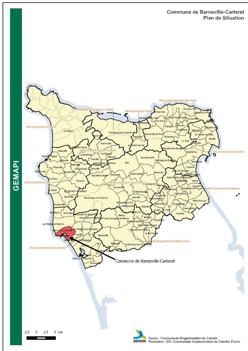
Figure 1 : Localisation commune de Barneville-Carteret, 2021

En application des articles L.123-6 et R. 123-7 du code de l'environnement, la communauté d'agglomération du Cotentin a sollicité Monsieur le Préfet de la Manche pour que soit organisée une enquête publique unique afin de mettre en place la servitude d'utilité publique pour la « défense contre les inondations et contre la mer », instaurée par la loi MAPTAM du 27 janvier 2014 (article L.566-12-2 du Code de l'environnement) sur une digue de Barneville-Carteret située en bordure de havre (figure 1). Depuis le 1 er janvier 2018, le service gestion des milieux aquatiques et prévention des inondations (GEMAPI) de la communauté d'agglomération du Cotentin est gestionnaire de digues sur la commune de Barneville-Carteret.