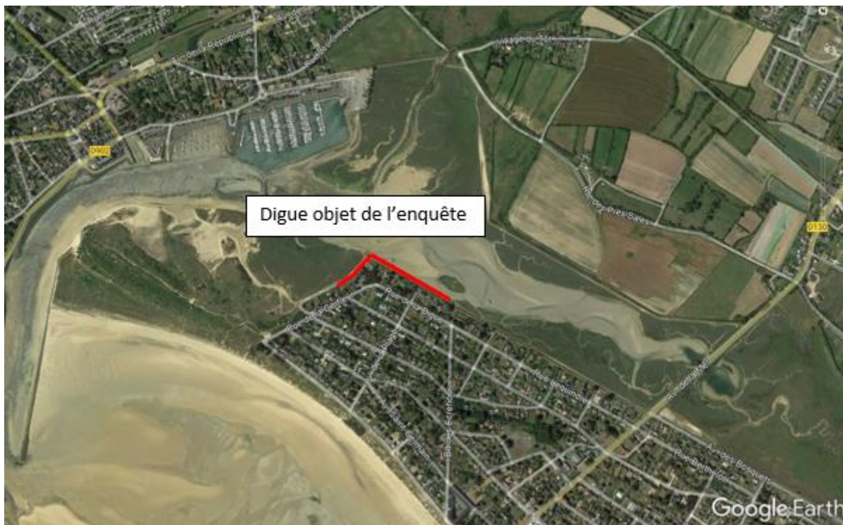
Figure 2 : Localisation de la digue du havre de Barneville-Carteret, Google Earth, 2019