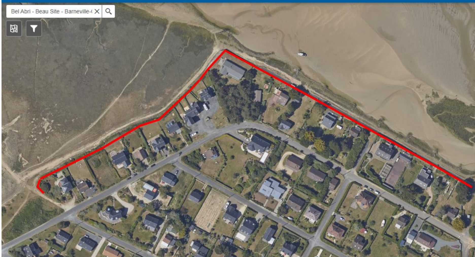
Digue classée « Bel Abri – Beau Site »