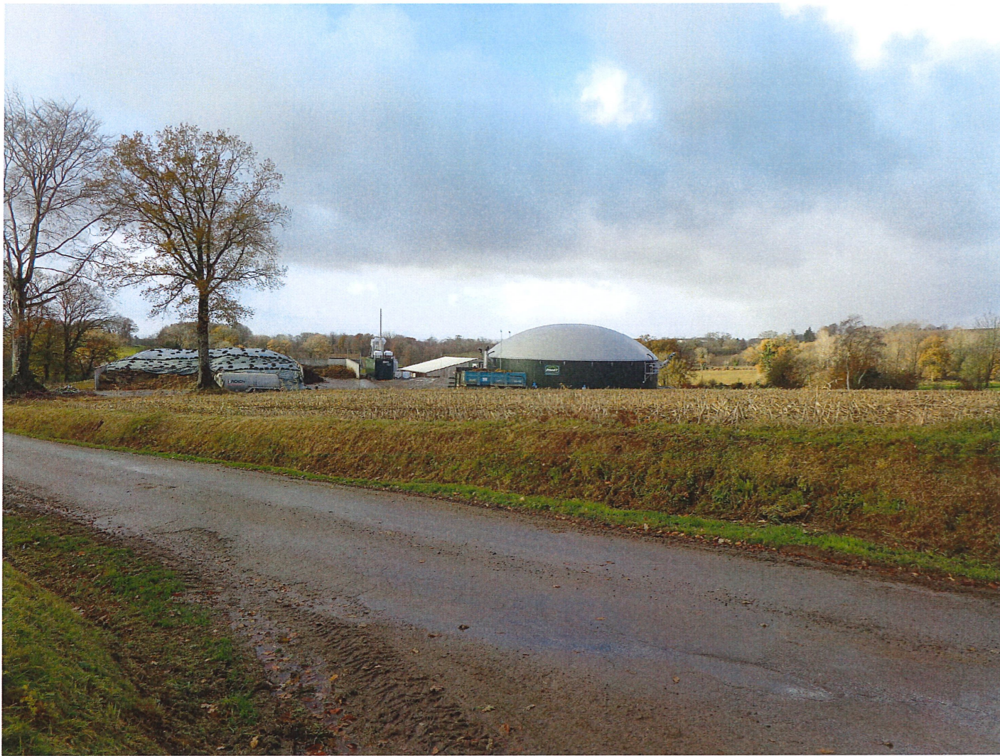
Vue 1 Photographie proche