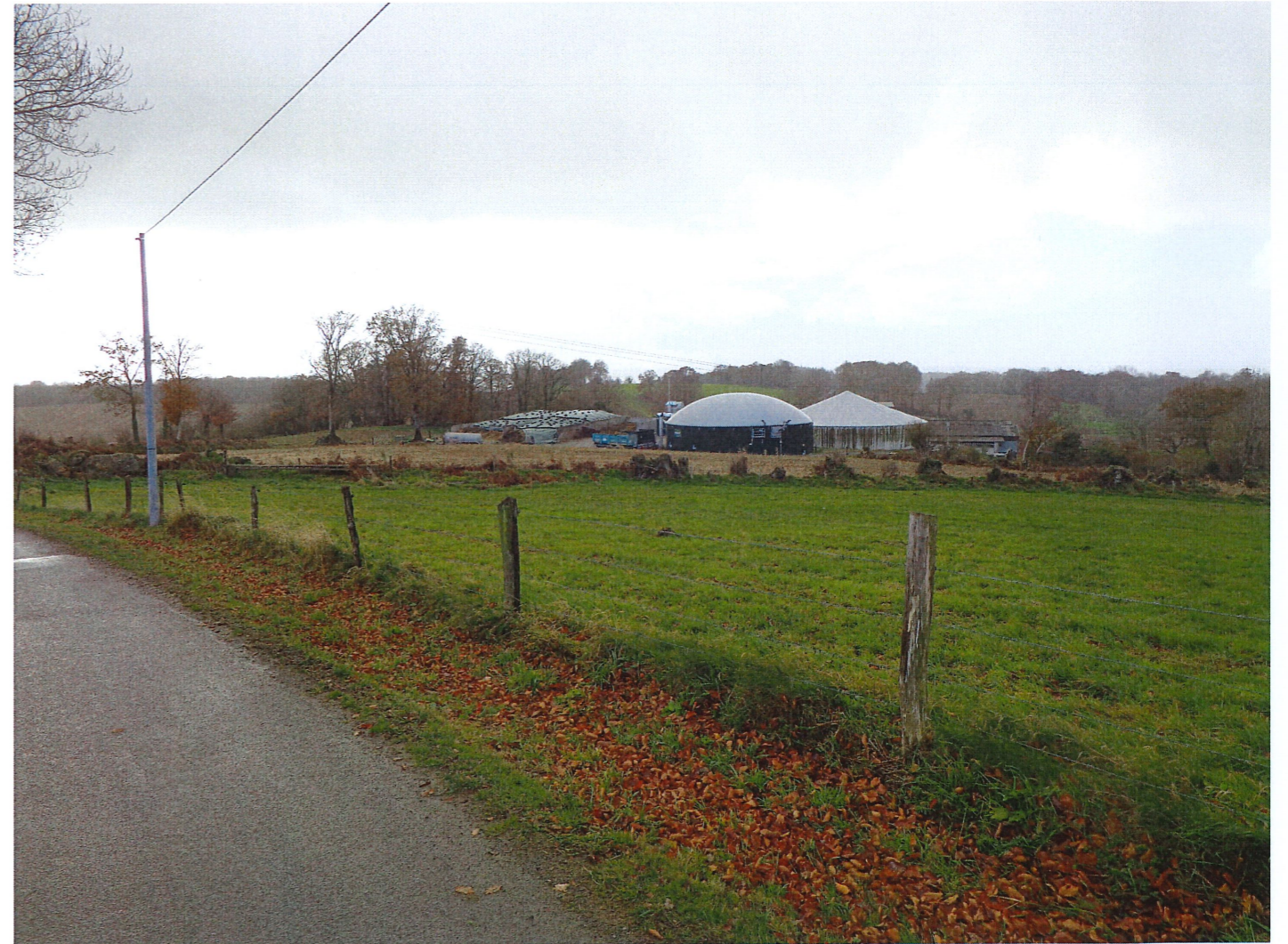
Vue 2 Photographie lointaine