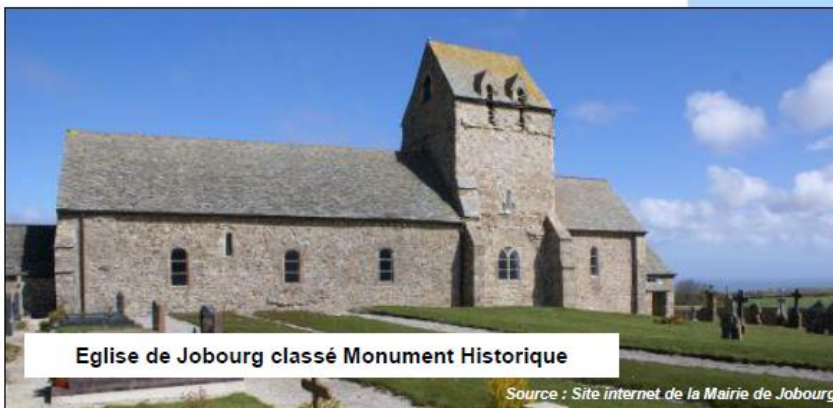
Eglise de Jobourg classé Monument Historique