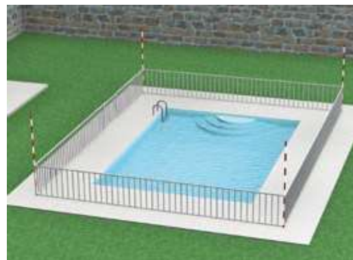
Piscine privée équipée d'une barrière de sécurité

Ces repères seront conçus pour être bien visibles et alerter les intéressés du danger potentiel.