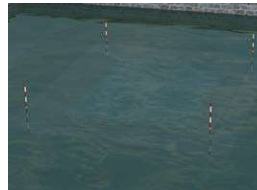
Les piquets délimitent l'emprise au sol de la piscine lorsque le niveau de l'eau dépasse la barrière