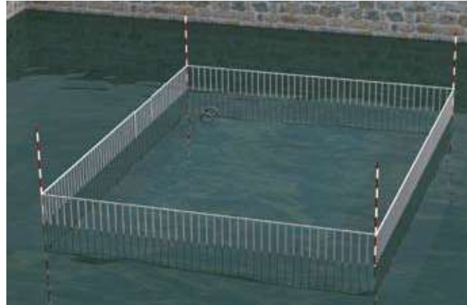
La barrière de sécurité reste visible tant que le niveau de l'eau est inférieur à sa hauteur