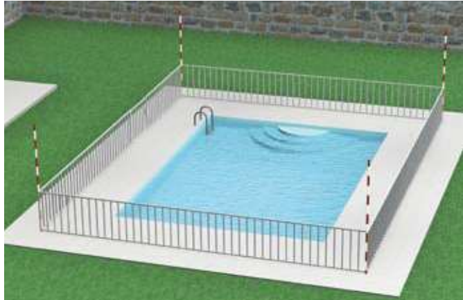
Piscine privative équipée d'une barrière de sécurité

Entretien des barrières conformément aux instructions du fabricant.