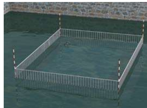
La barrière de sécurité reste visible tant que le niveau de l'eau est inférieur à sa hauteur