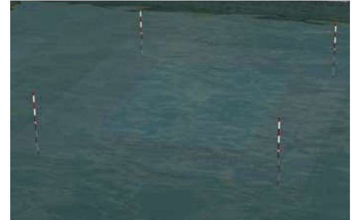
Les piquets délimitent l'emprise au sol de la piscine lorsque le niveau de l'eau dépasse la barrière