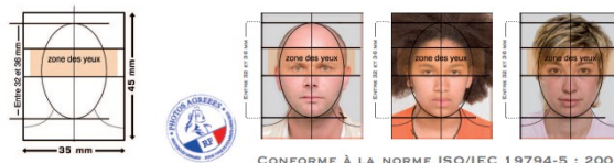
CONFORME À LA NORME ISO/IEC 19794-5 : 2005

Les photographies devront être au format 35 mm (0/-1 mm) x 45 mm (0/-1 mm). La prise de vue doit être récente et ressemblante au jour du dépôt de la demande et de retrait du titre. Les photographies doivent être réalisées par un professionnel ou dans une cabine photo, utilisant un système agréé par le ministère de l'intérieur.