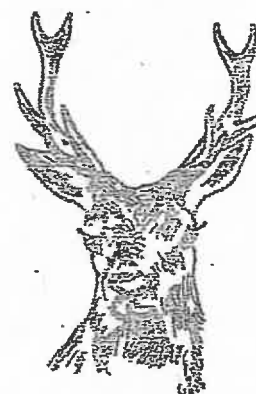
10 cors à petites fourches (moins de 10 cm de longueur)