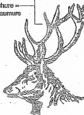
Cerf à double empaumure