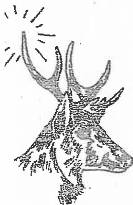
8 cors à surandouillers