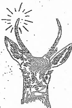
4 cors fourchu bas