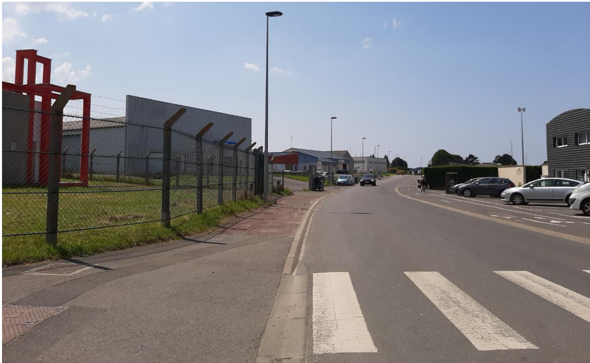
Prise de vue 4bis (Groupe IDEC – 20/07/2021)