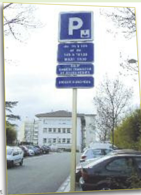
Signalisation mise en place à Bron

des commerçants, journal municipal, signalisation bien visible sur zone, etc. sont des outils d'accompagnement nécessaires.