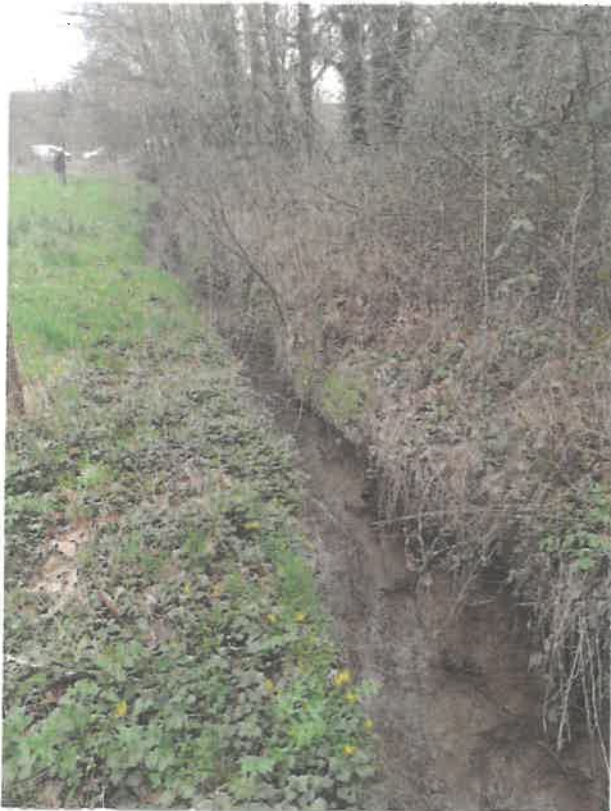
Ruisseau exutoire situé entre les parcelles ZB56 et ZB55