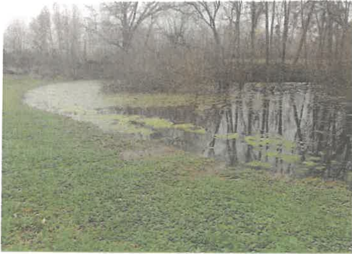
Retenue d'eau au pied de la parcelle ZB106