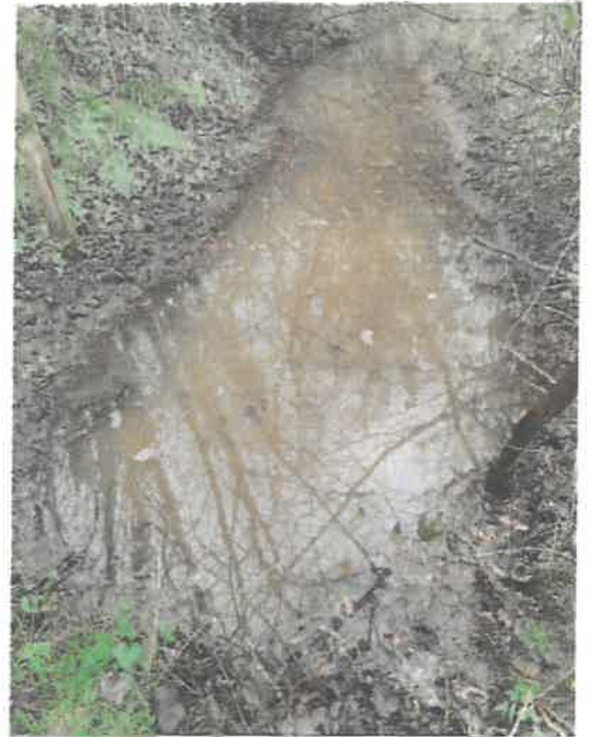
Bras mort exutoire du busage et accumulation de boues