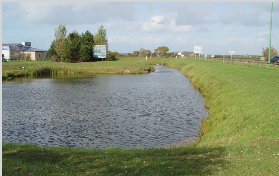
Le parc d'activités de la côte ouest, à Créances

Ce forum n'avait pas la prétention de répondre en une demi-journée aux diverses et nombreuses attentes des personnes présentes, notamment d'un point de vue technique. Un approfondissement du sujet exigera sans doute une réunion d'information spécifique dans un autre cadre à définir (un atelier de formation, par exemple).