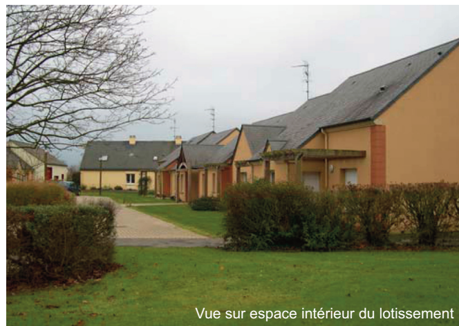
Vue sur espace intérieur du lotissement