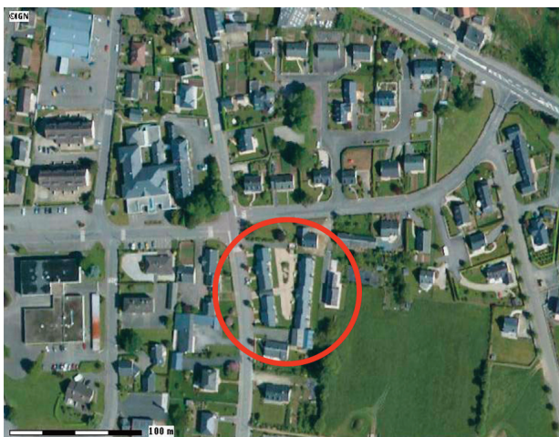
▲ Commune de Le Teilleul - 10 logements inter-générationnels

Bien que souvent dépréciée, par les élus ou les habitants, la densité est un facteur de création de services et d'urbanité. Il convient de réfléchir à ce qu'est « une densité vivable », à son aptitude à donner un sens à l'espace public et à révéler l'identité et la vitalité d'un quartier. La responsabilité des collectivités locales dans sa définition et son acceptation s'avère capitale. Il s'agit, dès la phase de programmation, de définir les objectifs de densité souhaités. Les conditions doivent être réunies, voire créées en phase de programmation pour pouvoir laisser la plus grande liberté aux équipes de conception, afin de capter les potentiels des sites et de faire de « l'architecture urbaine ».