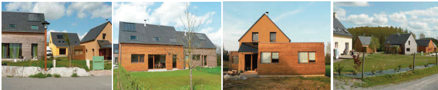
Bâtiments modulaires avec garages regroupés extérieurs

Partenaires : Syndicat Mixte du Scot du Pays de la Baie du Mont-Saint-Michel